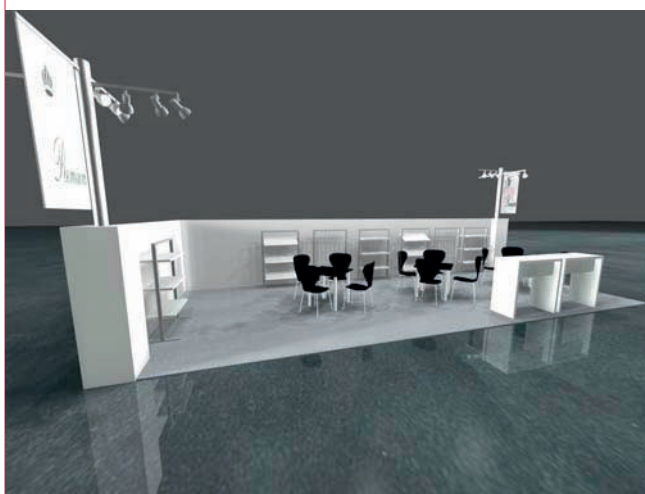
Standard Premium stand: Eckstand - Corner stand